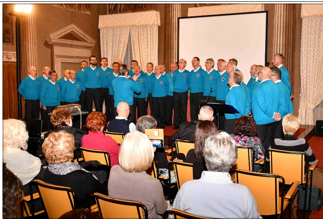
Il Coro CAI Cinisello Balsamo durante l'esibizione nella sala dei paesaggi della Villa Ghirlanda