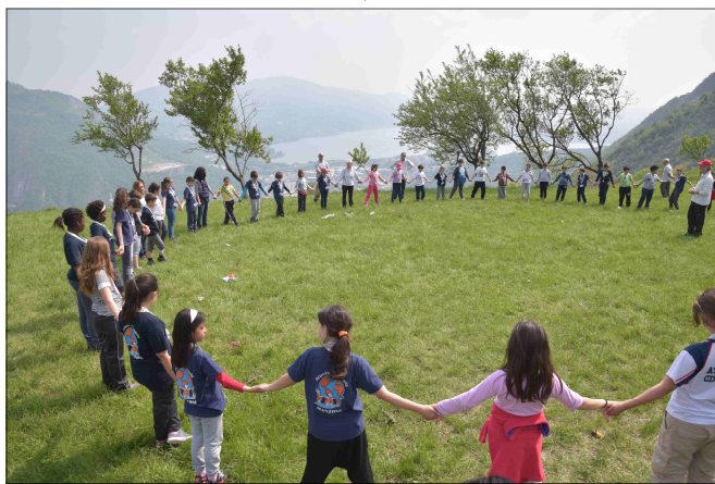
Il saluto alla Montagna

E' una significativa esperienza, faticosa ma densa d'emozioni e di felicità che ci fa sicuramente continuare in questa meravigliosa iniziativa.